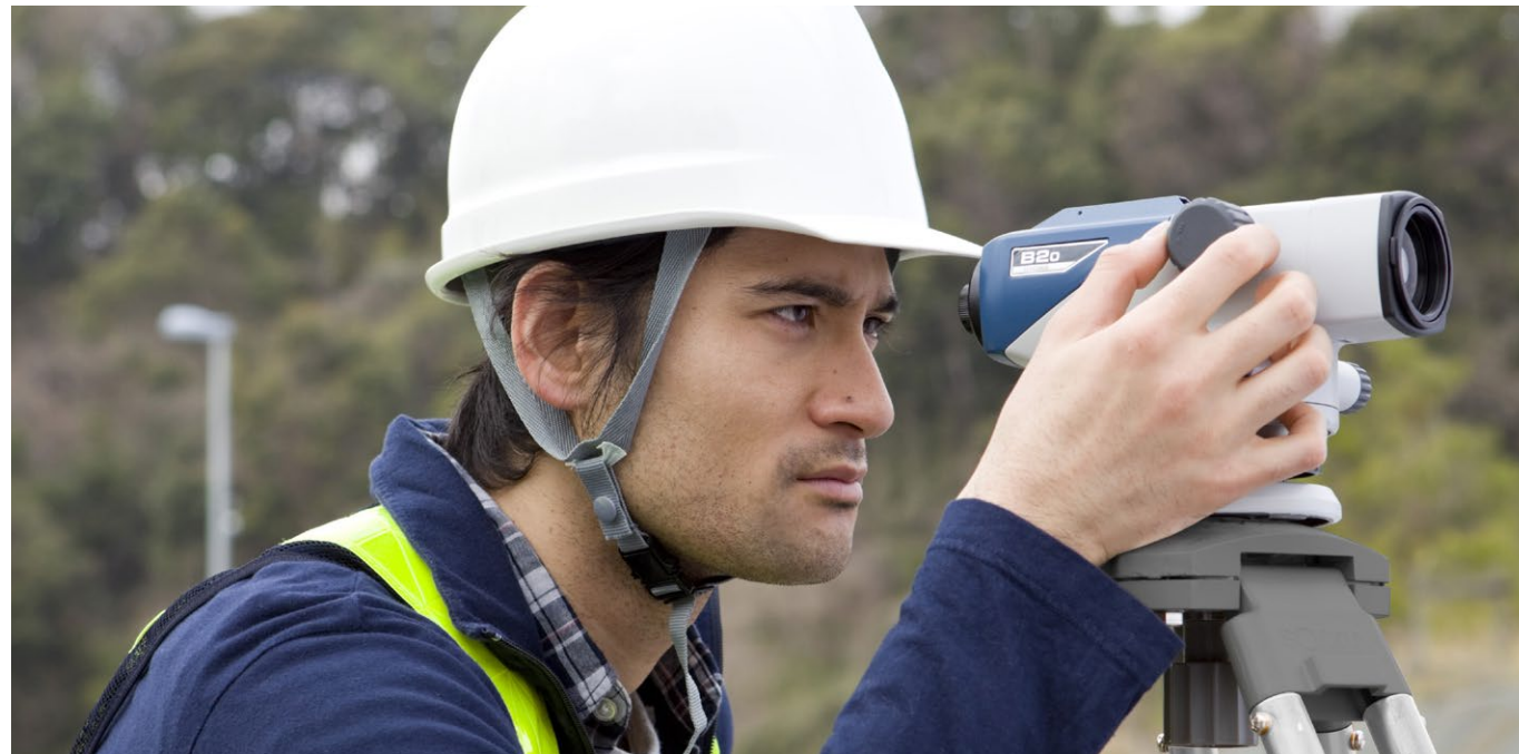
高倍率の高精度モデル