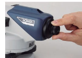
40x 接眼レンズ EL5 (B2o)

望遠鏡に光学マイクロメーターを取り付けることにより、0.1mm まで高さを読取ることが可能となります。精密水準測量、工作機械の据付等、高精度が要求される作業に活用いただけます。