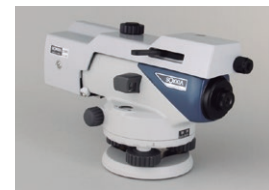
光学マイクロメーター OM5 (B2o)

接眼部に取付けることにより、90度方向からのぞくことができます。低位置での観測や、狭い場所での観測に便利です。