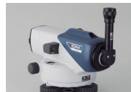
ダイアゴナルアイピース DE16 (B2o)

接眼部に取付けることにより、90度方向からのぞくことができます。低位置での観測や、狭い場所での観測に便利です。