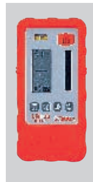
プロテクタLRP1装着時