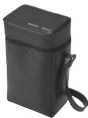
キャリングケース