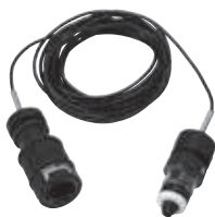
リモートケーブル5m